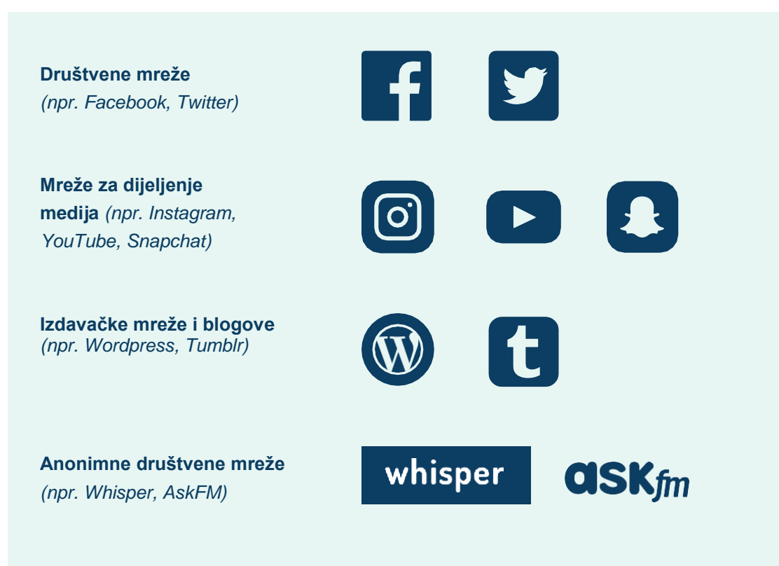
Slika 4. Neki primjeri društvenih medija

Također, može biti korisno identificirati različite kategorije društvenih medija i porazgovarati o tome kako djeluju, koja je njihova publika i zašto ih ljudi koriste. Društveni mediji uključuju: